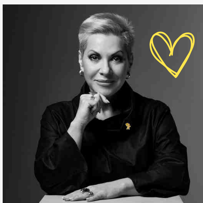
Operní pěvkyně Dagmar Pecková, první patronka výzvy Mantinely demokracie.

Rekonstrukce státu přinesla skóre transparentnosti všech prezidentských kandidátů. Zároveň jsme upozornili, že neznáme pravé sponzory prezidentské kampaně Miloše Zemana. Společně s Datlab Institut jsme vyčíslili reálnou hodnotu Zemanovy kampaně včetně „návštěv krajů“ a neplacených televizních vystoupení.